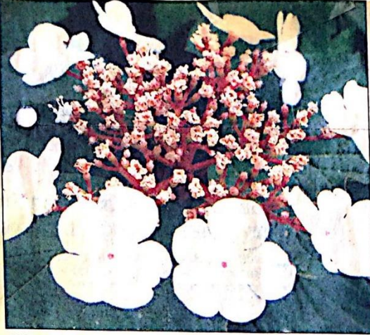
Sifa amaçlı olarak dünyanın çeşitli yerlerinde tercih edilen gilaburunun, çiçek ve meyvelerininin güzel görüntüsü aynı zamanda bir süs bitkisi olarak değerlendirilmesini sağlıyor.