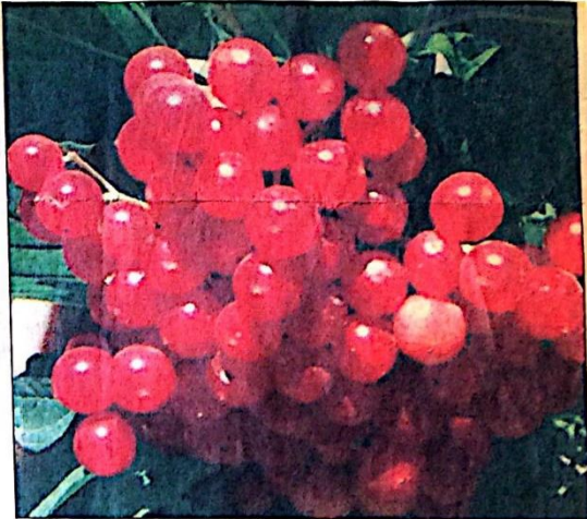
Başta kalp hastalıkları olmak üzere kanser gibi çok sayıda hastalığın tedavisinde kullanılan gilaburu meyvesinin yetiştiriciliğinin teşvik edilmesi gerektiği bildirildi.